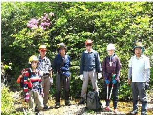
水飲み場でも集合写真