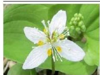
三つ葉黄連 僧悟台

老神温泉に着いたのが午後五時過ぎで、早速風呂に入りバイキングの夕食。明日早いので早々床に就く。六月十五日四時半起床、五時四十五分宿を出る。夜中から降り出した雨、強い雨ではない。このままで居てくれと願い出発する。皇海山入口の看板を頼りに車を進める。皇海山アプローチの道、栗原川林道。砂利道で左側は岩盤を切り崩し、右側は栗原川の絶壁で谷底が見えない。所々に落石。車から降り、落石をかたしながら進む。林道約二十分、位置が二時間も掛かってしまう。途中追い越して来たワゴン車のパーティは私達より一足先に出発して行く。朝食もそこそこにかッパを付けての入山。八時半の出発となる。登山道には看板や赤布も付けられ迷う事はないが、何回かの徒渉、靴は時々水中。増水時は危険なので諦めたほうが良い。沢を詰め、水の量も少なくなると、急な沢となる。不動沢コルの下は右側の急斜面をトラロープや木の根、木に頼