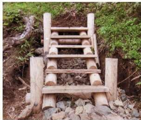
不忘山登山道、橋を兼ねた階段

車場で私の車を見て来てくれることが判ったらしい。昨年の不忘山山行では安達太良山の様に荒れた登山道だった。今年はユキトリ沢上から不忘の碑下までの登山道の約半分位が整備されていた。水流を止める土止めや階段、大きな丸太を利用して梯子状の階段、そして階段の間やその他の