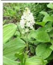
コバイケイソウ 僧悟台

●編集部連絡先 二本松市木ノ根1-5-15 0243(22) 4245 渡辺 正