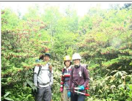
9時36分、両側全て紅更紗ドウダン