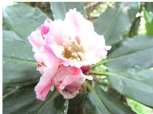
白山石楠花が開花していた