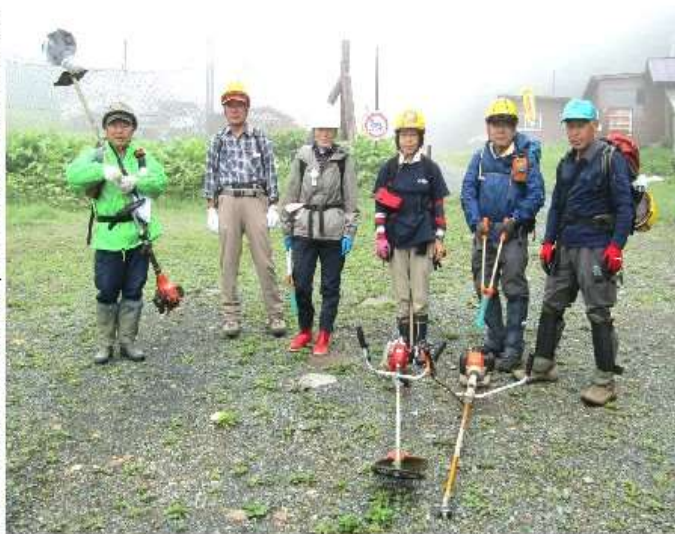
午前7時43分、塩沢登山口出発

僧悟台登山道は塩沢登山口から入り、広大な溶岩台地「僧悟台(江戸時代の地図では入会地を示す「相郷」と記されている)」を通過して鉄山と箕輪山の中間・山頂稜線「笹平」を目指す安達太良山では中級以上とされるルート。静かで高山植