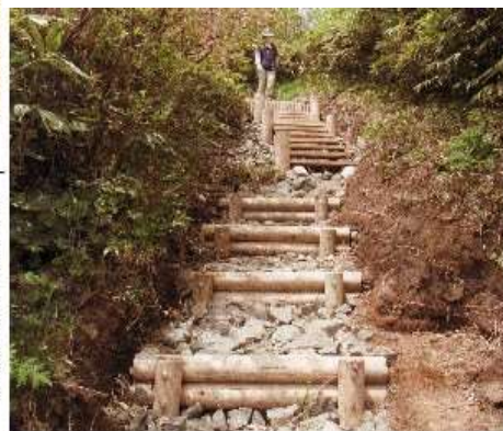
不忘山登山道階段

難でできる登山道を望む。山の会の登山道整備ではたかが知れている。行政も口先だけでなく実行に移して欲しい。