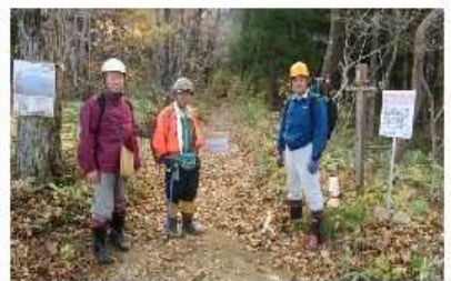
塩沢登山口も閉鎖

今年の装備点検は十一月二十三日(土) 勤労感謝の日、二本松市中里の□□さん宅で開催された。役員は午後一時集合で会場や料理の準備をした。午後二時には一般会員も集まった。