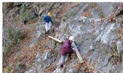
屏風岩向、棧橋撤去作業

○天狗岩下の橋は流出、橋材も不明。 ○荒竜岩アルミ橋は、流出していたが蛇籠橋材とも使えそう。 ○荒竜岩上橋は健全。 ○天狗の庭橋は流出、橋材はある。 ○馬返し橋は流出、橋材はある、架け直し出来る。 ○屏風岩向の「棧橋」は取り外した。