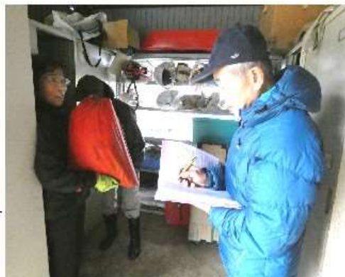
ロッカーの前で点検中

□□会長の挨拶で始められた。メニューは、焼肉とキノコ汁、ビール、日本酒、盛り焼酎などが弾み、暗くなるまで賑やかに繰り広げられた。昨年と同じく十二名が参加した。