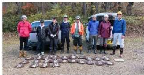
撤去した丸札と参加者

○天狗岩上のアルミ橋は蛇籠の橋台二つとも崩壊している、アルミ橋材は使えそう。 ○荒竜岩下橋は流出、橋材も不明。 ○荒竜岩アルミ橋は、流出していたが蛇籠橋材とも使えそう。 ○荒竜岩上橋は健全。 ○天狗の庭橋は流出、橋材はある。 ○馬返し橋は流出、橋材はある、架け直し出来る。 ○屏風岩向の「棧橋」は取り外した。