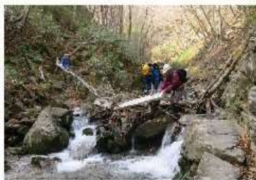
荒竜岩橋の撤去作業

○天狗岩上のアルミ橋は蛇籠の橋台二つとも崩壊している、アルミ橋材は使えそう。 ○荒竜岩下橋は流出、橋材も不明。 ○荒竜岩アルミ橋は、流出していたが蛇籠橋材とも使えそう。 ○荒竜岩上橋は健全。 ○天狗の庭橋は流出、橋材はある。 ○馬返し橋は流出、橋材はある、架け直し出来る。 ○屏風岩向の「棧橋」は取り外した。