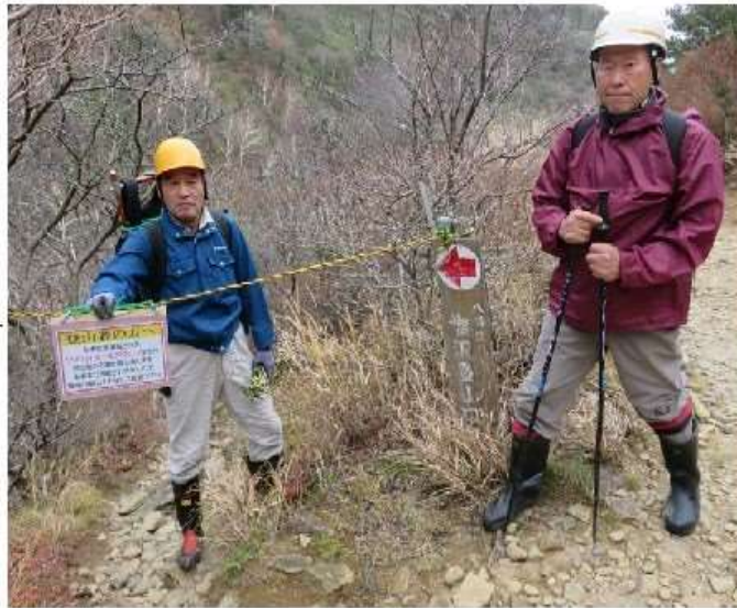
13時16分 小屋下「塩沢別れ」に閉鎖看板設置

八日(日)、湯川溪谷登山道の冬季閉鎖作業が行われた。設置されていた「サイン看板(丸札道標)」の回収、徒渉用の橋板取り外しが行われた。登山道の塩沢スキー場側入口、くろがね小屋下の「塩沢別れ」登山道入口はトラロープが張られ、閉鎖された旨の看板が設置された。この閉鎖処置は来年の山開き前に、丸札道標設置や徒渉箇所への橋板が設置されて解除される。当日の湯川溪谷は、大