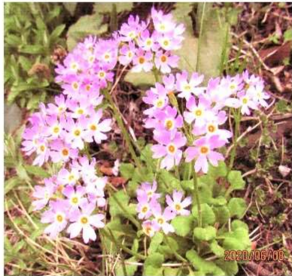
6月8日、不忘山、ユキワリコザクラ

ていた。カレ場で休憩。「ユキワリコザクラ」はじめ「イワカガミ」「ハクサンイチゲ」など、今迄よりは少ない様に思うが、私達の目を楽ませてくれる。不忘の碑を過ぎると花の数も多くなり、マダラ模様の残雪を見ながら山頂へ。予定より三十分遅れの十一時半、刈田岳方面からの登山者も多く山頂は賑やかだ。多くの花々と眺望を楽しみ、午後一時山頂から下山。白石スキー場駐車場へ四時無事下山、帰路に着く。六時半帰宅。