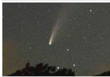
奥岳からの ネオワイズ彗星

八月二日(日) 漸く、今年 の梅雨が明けました。梅 雨入りは六月十一日頃で したが、六月末から七月殆ど 晴れた日がありませんで した。台風も発生しません で。例外は七月十九日 (日) 一日だけ、朝から夜 まで晴れ、奥岳でネオワイ ズ彗星を見る事もできま した。