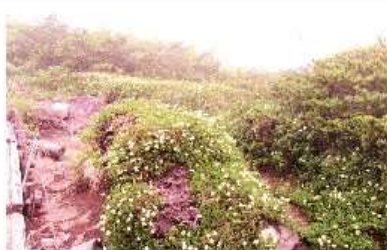
6月22日、南蔵王・芝草平

道)で昼食。寒くて口元から白い物、震え上がってしまった。早々に切り上げ杉ヶ峰迄戻ると、天気も回復し刈田岳なども見えて来た。前山から眼下に広がる風景「アオモリトドマツ」の大木の殆どが枯れ、昨年の地蔵岳で見た傾向と同じである。蔵王の樹氷、やがて見る事が出来なく成るだろう。コロコロ変わった今回の山行、花見山行としては良かったかも知れないが、無計画の山行。危険な行動、深く反省している。