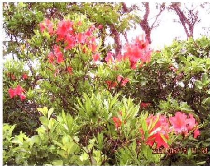
6月16日、安達太良山、レンゲツツジ