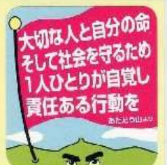
二本松図書館のカウンタにあったシール