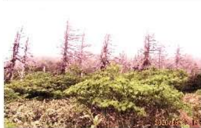
アオモリトドマツの枯れ木

岳まで行く事になり、エコーラインに入る。ライダースキーワールドあたりから熊野岳の山頂がはっきり見える。熊野岳も諦め刈田峠より芝草平に行く事になる。駐車場は多くの車でガードレールぎりぎり止める。十時十五分入山。山道には「チドリ草」「ツマトリ草」「チングルマ」「イワカガミ」など多くの花々が迎えてくれた。杉ヶ峰で休み、少し寒さもあり防寒着着用。「ハンショウヅル」や「峰桜」が迎えてくれ、沢には残雪も見ることができ。芝草平十二時、木道脇の湿原には、「チングルマ」「ヒナザクラ」「ワタスゲ」「イワイチヨウ」等埋め尽くされていた、やみつきになる様だ。遊歩道終点木